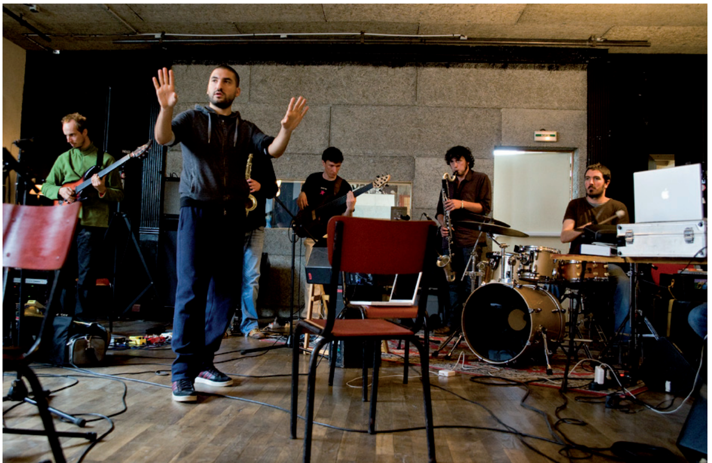
Séance de travail avec Ibrahim Maalouf - La Grande Boutique à Langonnet-septembre 2010

Ibrahim Maalouf est un jeune libanais à la trompette voyageuse ! Diplômé du Conservatoire national supérieur de musique de Paris, l'artiste glisse allègrement du jazz au classique, et se joue des musiques arabes traditionnelles ou contemporaines. Armé d'une trompette à quarts de tons inventée par son père dans les années 60, Ibrahim compose également pour nombre d'orchestres, tentant de faire le pont entre ses deux cultures arabes et françaises. A à peine 30 ans, il a déjà derrière lui une longue série de collaborations : Sting, Vincent Ségal, Amadou & Mariam, Matthieu Chedid, Lhasa de Sela, Angel Parra, Jeanne Cherhal, Arthur H, Marcel Khalifé... Victoire de la révélation instrumentale de l'année 2010 pour les Victoires du Jazz.