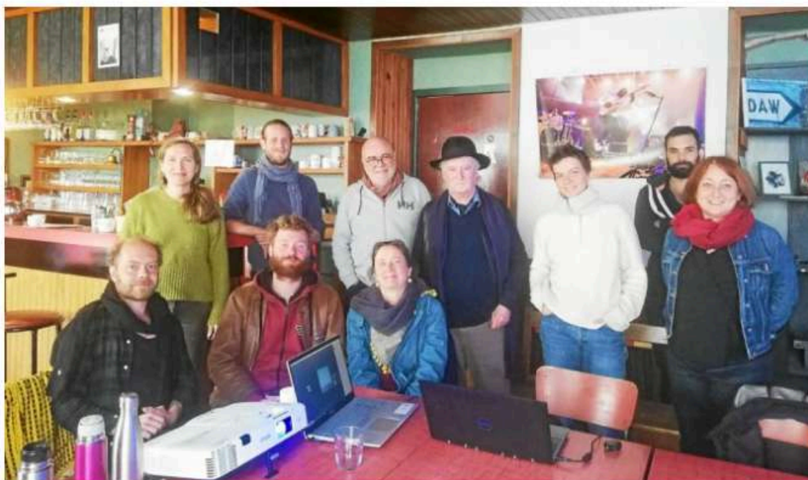
Les membres de l'association Drom lors de leur assemblée générale à la Grande Boutique, à Langonnet.

L'association Drom, à Langonnet, a fait un point sur le festival Plancher du monde, lors d'une assemblée générale, samedi 29 avril 2023.