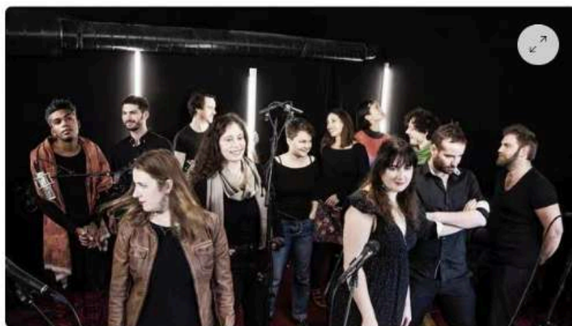
Le 9e collectif de Kreiz Breizh Akademi.

Chaque matin, recevez toute l'information de Châteaulin et de ses