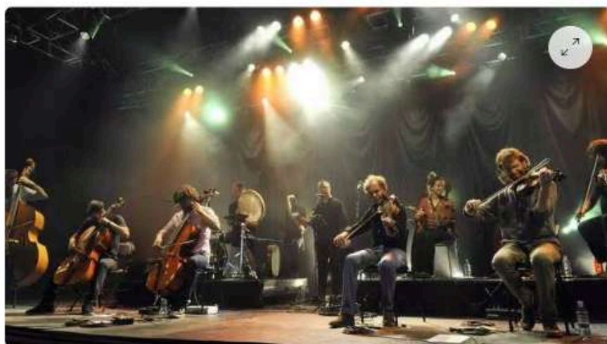
Kreizh Breizh Akademi n° 5 au festival des Vieilles Charrues en 2015.

L'appel à candidatures est lancé pour participer à la 10 e promotion Kreiz Breizh Akademi, ce bouillonnant laboratoire de création lancé par l'association DROM d'Erik Marchand. Cette 10 e session débutera en janvier 2024. Pendant plus d'un an, les musiciens suivront un cycle de formation professionnelle et bénéficieront de l'expérience d'artistes accomplis.