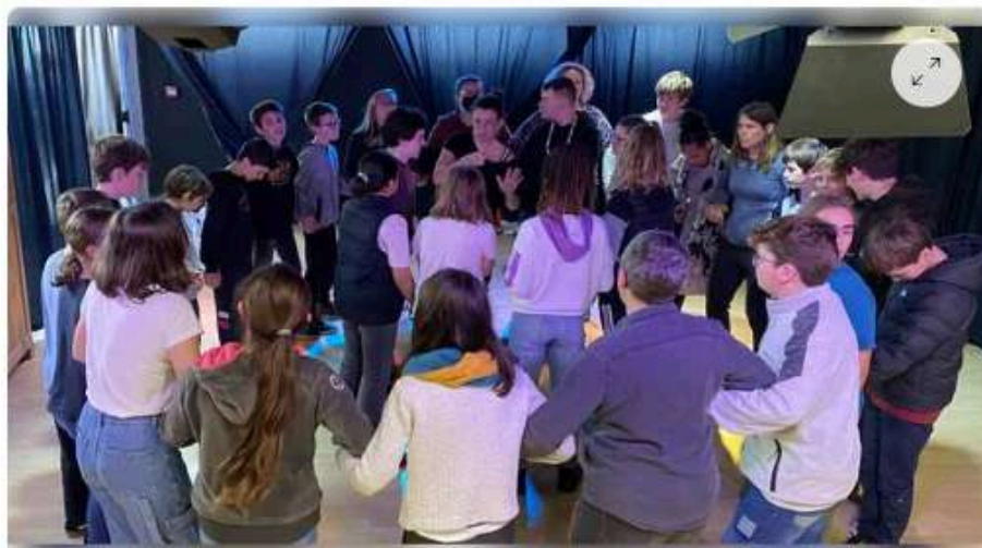
Afin de favoriser l'inclusion au collège Saint-Gildas, un partenariat avec l'association Drom est mis en place.