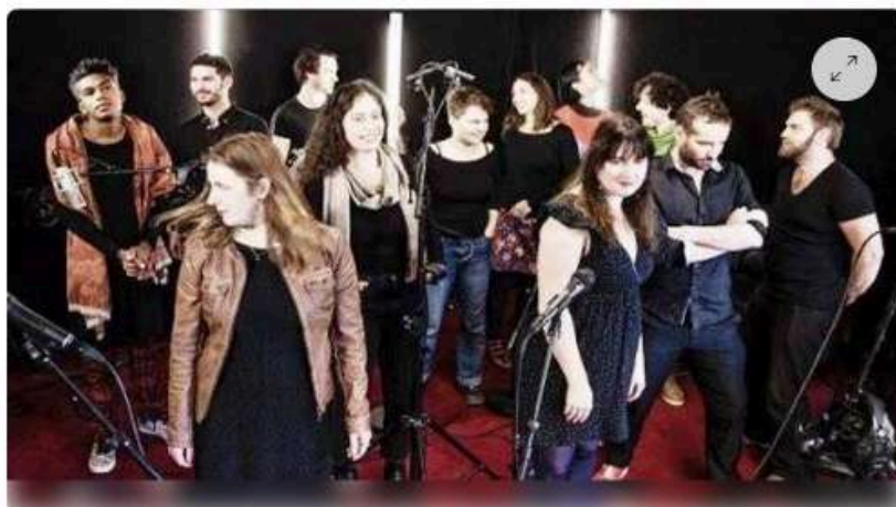
La Kreiz Breizh Akademi revient à Amzer-Nevez avec une toute nouvelle création sonore, jeudi.

La Kreiz Breizh Akademi présente, jeudi, à Amzer-Nevez, sa création Bruulu . Le collectif est un orchestre de six musiciennes et six musiciens. Titre inspiré du breton brulu , la digitale, plante médicinale dont l'action a des vertus thérapeutiques sur le cœur. Un nom également utilisé dans les expressions bien connues des bretonnants. Le répertoire, basé sur la tradition chantée de basse Bretagne, a été arrangé par les musiciens du collectif.